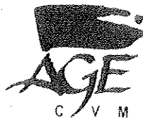
Table de concertation