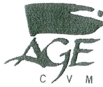
Table de concertation